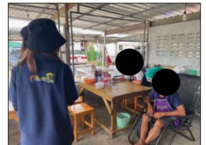
รูปที่ 2 ชุมชนในรัศมี 3-5 กิโลเมตร