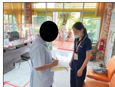
รูปที่ 3 หน่วยงานราชการ รัศมี 0-5 กิโลเมตร