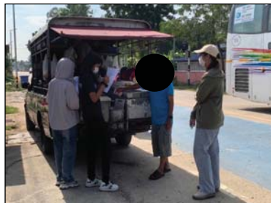
รูปที่ 1 ชุมชนในรัศมี 0-3 กิโลเมตร